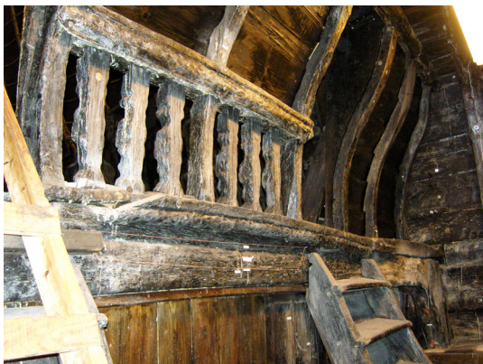
Interiörbild från Regalskeppet Vasa

seet i Karlskrona. (Forts. på nästa sida)